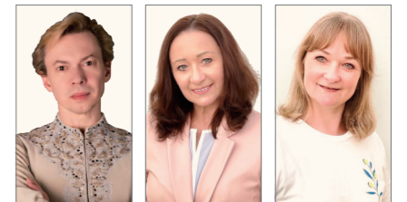
ウラジーミル・マラーホフ マルガリータ・ドゥジャコフ カテリーナ・エフチコワ

ウラジーミル・マラーホフ 針山愛美(Awaji World Ballet 総合芸術監督) 倉智太朗(元ベラルーシ国立ボリショイ劇場/バレエ団プリンシパル) マルガリータ・ドゥジャコフ カテリーナ・エフチコワ スヴェトラナ・シュリヒテル(元リビウ国立バレエ団ダンサー) ネリア・イワノワ(元リビウ国立バレエ団ダンサー) ソフィア・シェイコ(ハリコフ芸術大学卒業) 予定